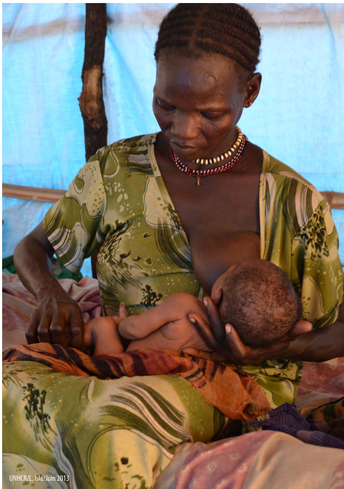
UNHCR/L. Isla/Juin 2013

Dans certains cas où la demande de SLM est forte, des contrôles supplémentaires peuvent être nécessaires pour prévenir les fuites et assurer la sécurité du personnel. L'étude de cas n° 8 illustre une telle situation. L'emballage peut également être marqué ou modifié pour limiter les risques de revente du SLM sur le marché.