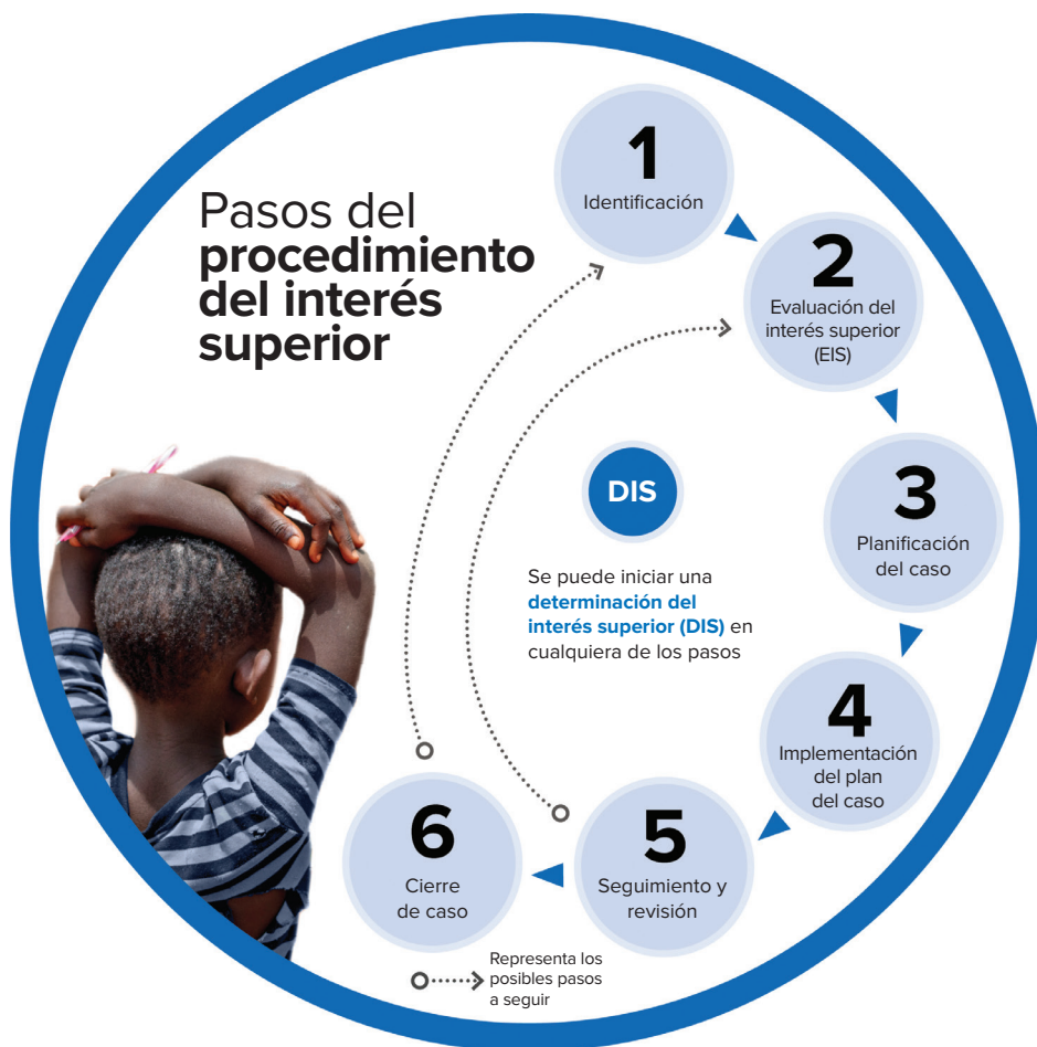
Figura D: Procedimiento del interés superior de la niñez y la adolescencia 54