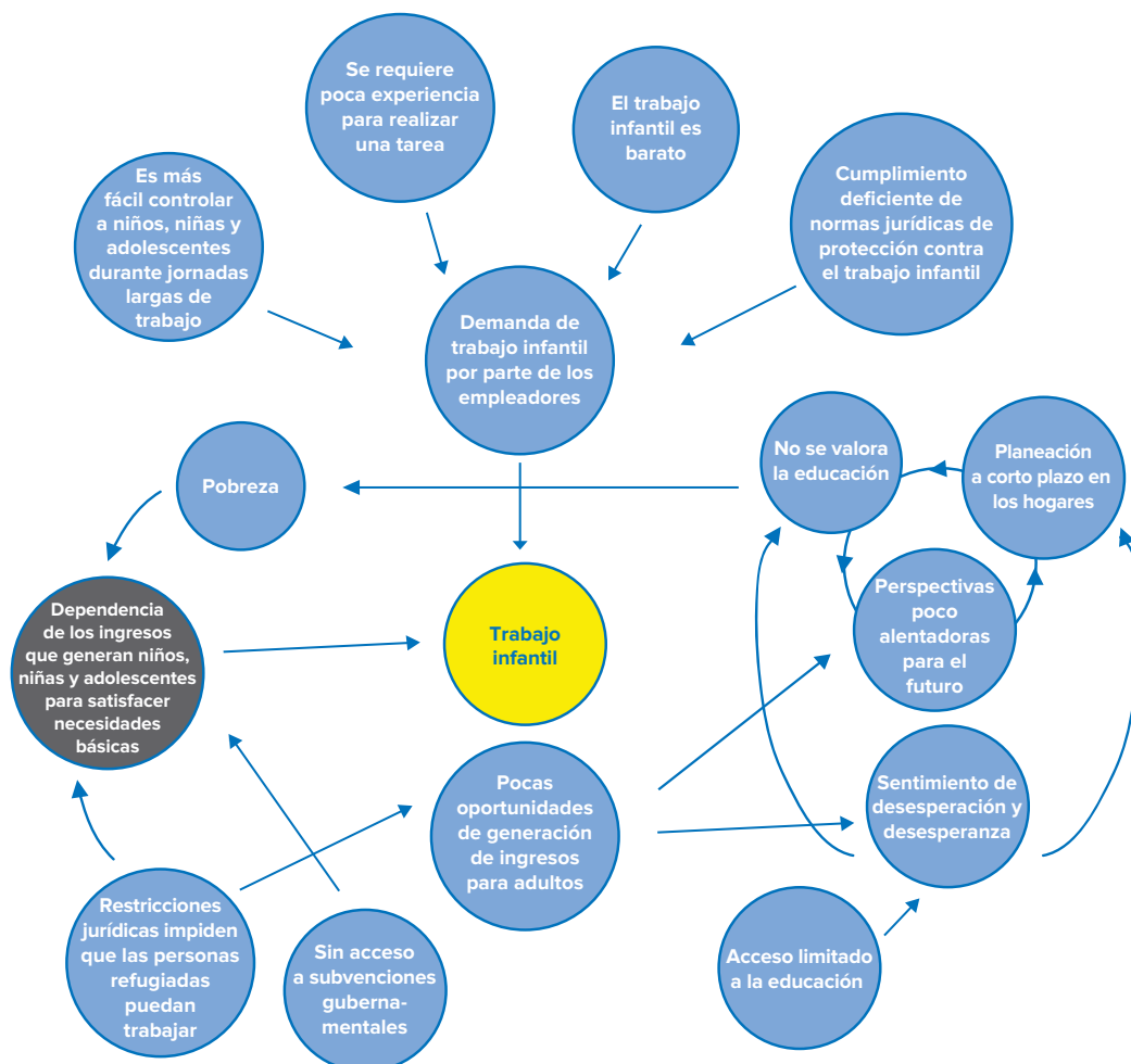
Figura A: Mapeo de los factores que explican el trabajo infantil

Las figuras A y B muestran el proceso de desarrollo de una teoría del cambio y utilizan el caso del trabajo infantil para ejemplificar las relaciones causales que pueden existir entre un riesgo de protección de la niñez y la adolescencia y la vulnerabilidad económica del hogar, entre otros factores. En este ejemplo, la asistencia en efectivo no puede afectar el riesgo (trabajo infantil) de manera directa, pero sí puede tener un impacto en la vulnerabilidad económica que hace que el hogar dependa de los ingresos generados a través del trabajo infantil para cubrir sus necesidades básicas. La figura A muestra cómo este análisis debe ser parte del entendimiento holístico de un riesgo específico de protección de la niñez y la adolescencia, dado que los riesgos para los niños, niñas y adolescentes suelen ser complejos y no se deben exclusivamente a un único factor.